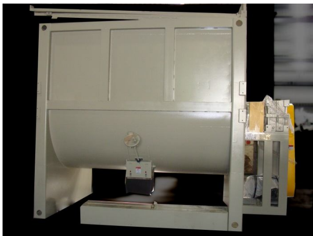
横式ブレンダー正面