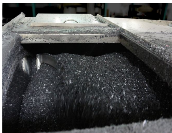
ブレンダー稼働様子