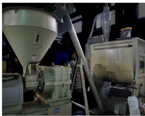
横式ブレンダー側面 + スクリューコンペア