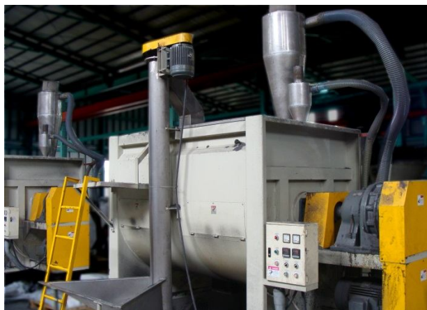
横式ブレンダー後ろ