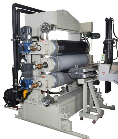
シートに転換するへ