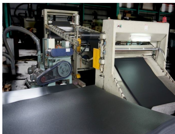
シートがいろいろな用途の製品へ