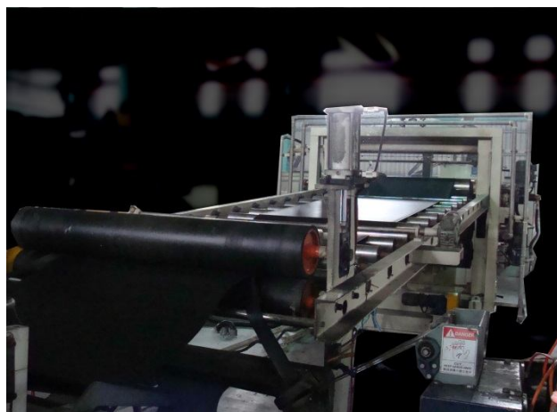
物性均一なシート製品になる